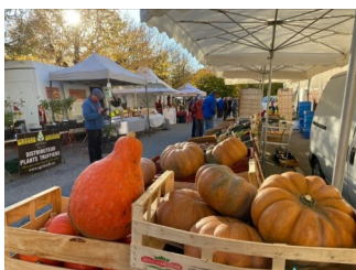
Clémentine Rigaud pour Beaufort en Foire

Réservation du repas traiteur au 06 03 04 38 22 avant le 12 octobre (repas servis à la salle d'animation).